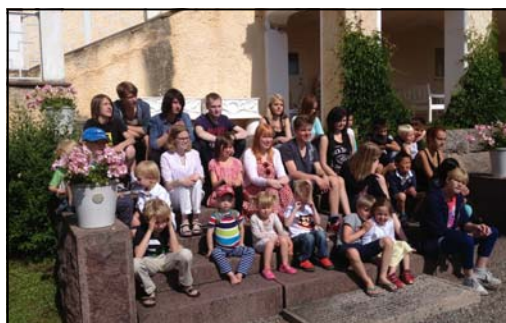
Alla barn och Ungdomar på träffen!